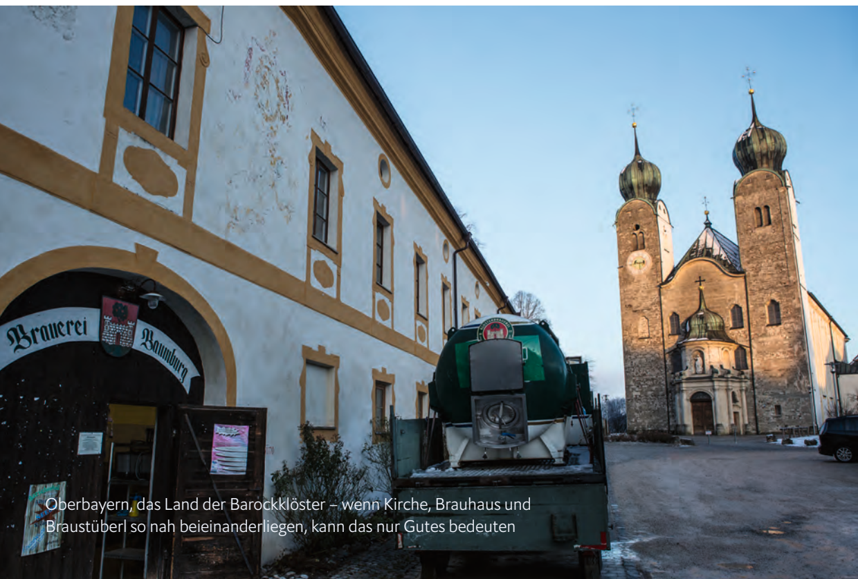
Oberbayern, das Land der Barockklöster – wenn Kirche, Brauhaus und Braustüberl so nah beieinanderliegen, kann das nur Gutes bedeuten