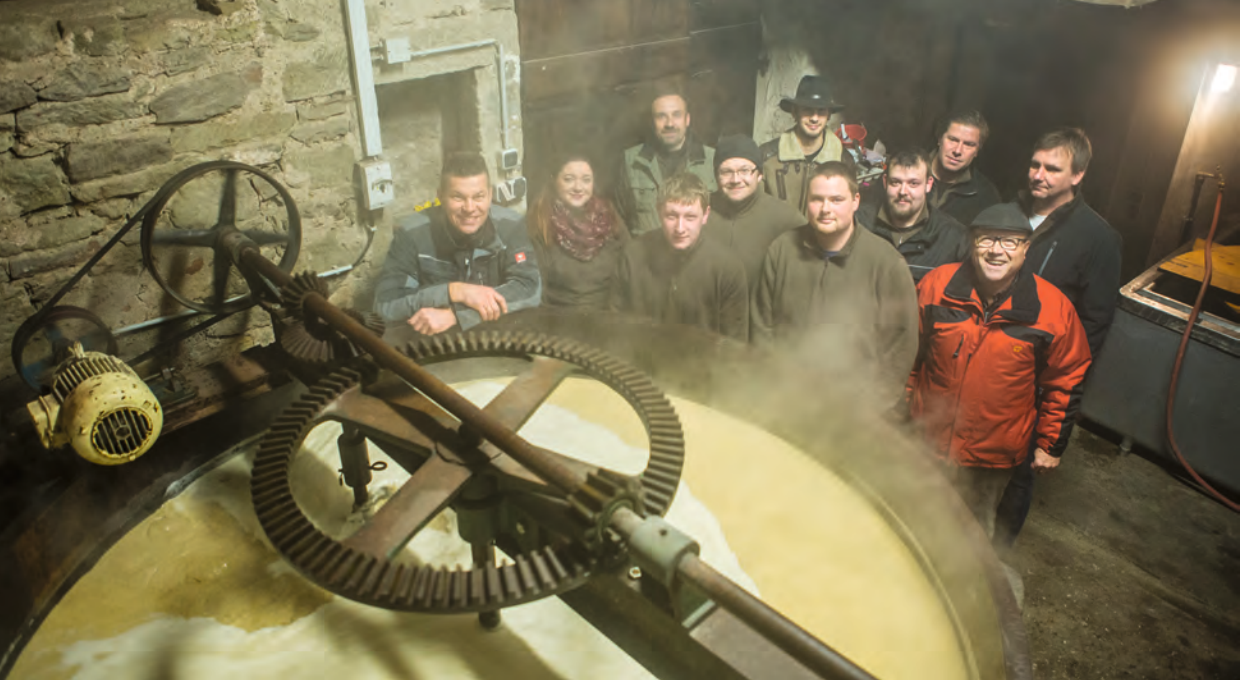
Gelebte Braukultur im unterfränkischen Junkersdorf: der über 100 Jahre alte Läuterbottich des Kommunbrauhauses wird regelmäßig genutzt