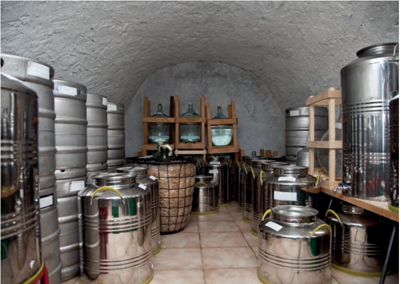
Ein kühler Gewölbekeller als Lagerraum für hochwertige Destillate vor der Abfüllung

selbst wenn das Wetter mal regnerisch sein sollte. Neben der 2018 eröffneten Schaubrennerei und einem Gasträum im alten Kuhstall, der auch für Seminare genutzt werden kann, rundet ein Hofladen das Angebot des Peterhofs ab.