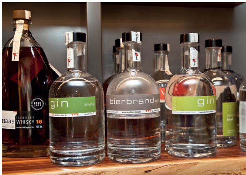
Eine kleine Auswahl der Edelbrennerei Haas

exzellentes Bier zu brauen, gepflegt wird, sollte nicht vergessen werden. Schließlich ist das Brauhaus mit seiner gemütlichen Gaststube ein lohnendes Ziel in der unmittelbaren Nachbarschaft der Brennerei, wenn man eine Pause einlegen will.