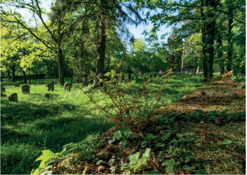
Schön gelegen: der jüdische Friedhof in Pretzfeld