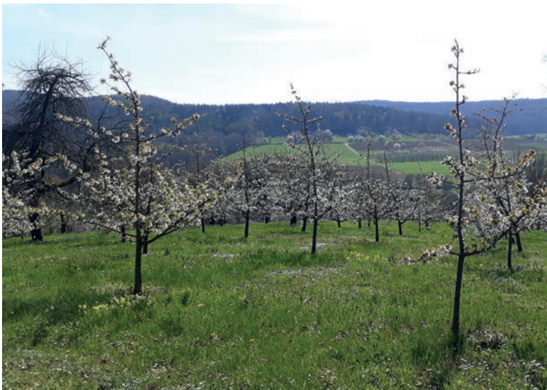
Blütenpracht um Pretzfeld

Ein kurzer Bummel durch Ebermannstadt lohnt sich. Nicht zuletzt locken zwei Brauereien zur Einkehr. Darüber hinaus kann man am Wasserschöpftrad , am historischen oder oberen Scheunenviertel und am alten Rathaus vorbei zum Marktplatz mit den beeindruckenden Fachwerkhäusern spazieren.